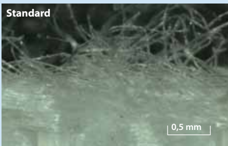
Bandkanten nach definierter Krafteinwirkung.

Frayfree Bandtypen sind besonders geeignet für den Transport verpackter und unverpackter Lebensmittel, z.B. Süß- und Backwaren.